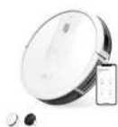
Eufy RoboVac 15C カラー：ホワイト、ブラック

https://www.anker-japan.com/pages/robovac-support