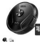
Eufy RoboVac X8 Hybrid カラー：ブラック、ホワイト