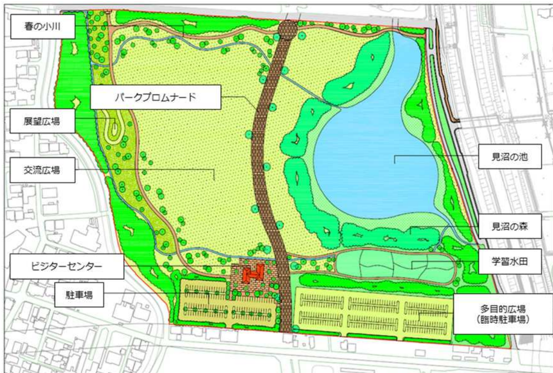
参考図 基本計画時点の平面図

なお、本業務はプロポーザル方式による業務委託であり、提案者には高度な創造性・技術力・専門的経験に基づき、業務全般について以下のような提案となることを求める。