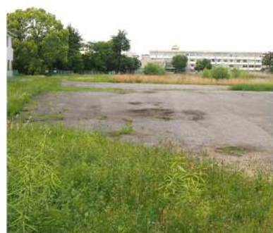
②アスファルト舗装、側溝、境界ブロック