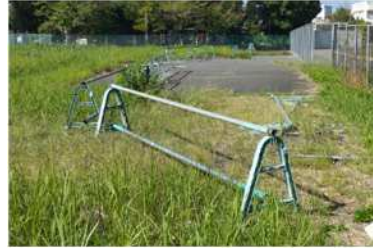
⑤アスファルト、バリケード