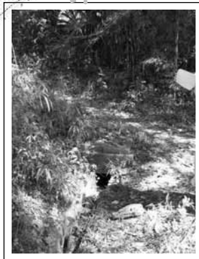
コンクリート部分の側溝の排水の様子