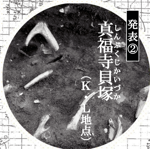
発表② しんぷくじかいづか 真福寺貝塚 (K・L地点)