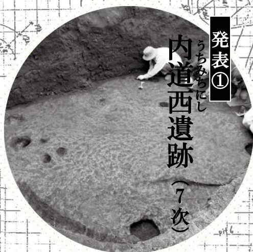
発表① うちみちにし 内道西遺跡 (7次)

令和元年度にさいたま市内において実施された発掘調査の主要な成果を市民の皆様いち早く紹介いたします。