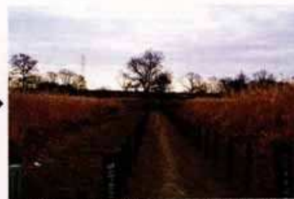
▲幅2mほどの緩衝帯（中央は園路）