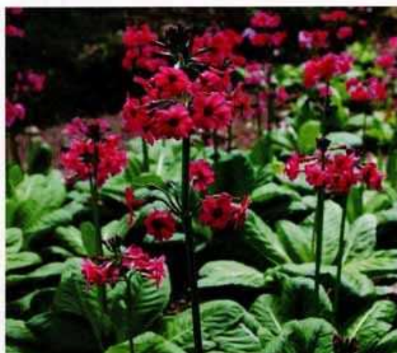
▲園内のクリンソウ（サクラソウ科サクラソウ属）

また、鉢植えのさくらそうの展示や、栽培したさくらそうの品種苗の販売により、来園者の方々に目を楽しん