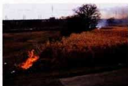
▲風上側からの着火