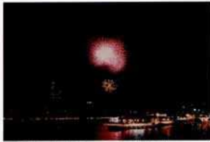
▲日本三大祭の一つ「天神祭」