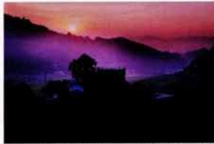
▲日本棚田百選に選ばれた熊勢町長谷地区の「棚田」