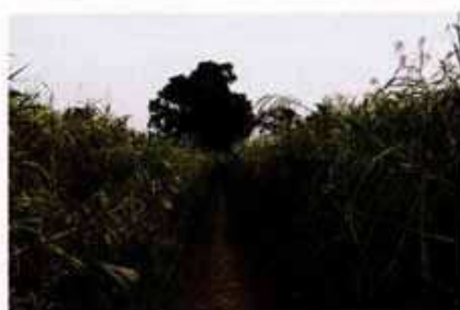
▲秋の自生地の様子

まもなく、自生地に見事なサクラソウ群落が出現する時期を迎えます。現在、田島ヶ原サクラソウ自生地では約150万株のサクラソウとノウルシ・チョウジソウなど約250種の植物が自生していますが、今回の「草焼き」による灰のおかげで、サクラソウの生育にどれだけ良い影響が出るのが、非常に楽しみです。