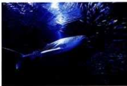
▲世界最大級の水族館「海遊館」