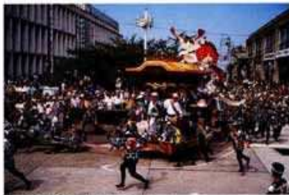
▲「岸和田だんじり祭」