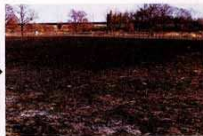
▲一面見通しの良い「原っぱ」に