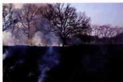
▲燃え終わった直後の自生地