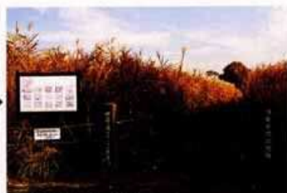
▲立ち枯れたオギ・ヨシ