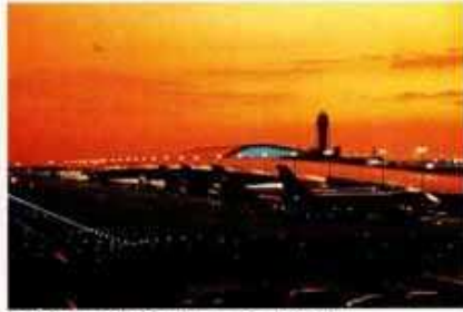
▲24時間空港の関西国際空港

る世界最大級の水族館「海遊館」、通天閣や大阪城といった名所・旧跡など、多彩な観光資源があります。