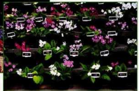
▲園内での日本さくらそうの鉢植展示