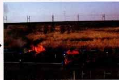
▲実験圃場での「草焼き」