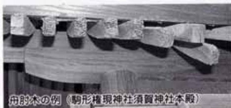
舟肘木の例（駒形権現神社須賀神社本殿）

ところで、神社や寺院では、下にあるような「文化財愛護シンボルマーク」をしばしば目にします。これは、「ひろげた手のひらのパターンによって、日本建築の要素である斗拱のイメージを表し、これを三つ重ねることにより、文化財を過去・現在・未来にわたり永遠に伝承していく」ことを意味していますが、この図案は神社建築の組物から来たものです。神社建築は、まさに日本の文化財保護の象徴といえます。