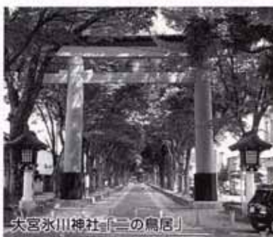
大宮氷川神社「二の鳥居」