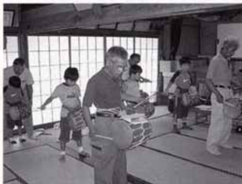
▲「南部領辻の獅子舞」の練習風景