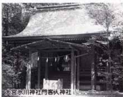
大宮氷川神社門客人神社

大宮氷川神社では、社殿の建替に際して、不要になった社殿などを他の神社に譲り渡すことをしています。大宮氷川神社は記録上、文禄5年（1596）、寛文7年（1667）に社殿を新たに建築していますが、その際、それまでの社殿を近隣の神社に譲渡・移設しています。上大久保氷川神社本殿、大間木氷川神社本殿（緑区、市指定）がそれで、市外ですが羽盡神社本殿（川口市、市指定）も大宮氷川神社から江戸時代の社殿を移設されたものです。さらに、大宮氷川神社は昭和15年に大々的に境内の整備をしましたが、それまでの社殿（寛文7年建立のもの、3棟あった）を取り壊すことなく、門客人神社、御嶽神社、天津神社として境内に残しています。そういえば伊勢神宮でも、20年に1回の式年遷宮で不要になった正殿の柱は、宇治橋の鳥居に転用されますし、他の部材も全国各地の神社で再利用されているのです。余談ですが、大宮氷川神社参道にある「二の鳥居」は日本最大の木造鳥居といわれ、明治神宮から移設されたものです。また、内谷氷川社境内（南区、市指定史跡）にある石鳥居や石橋も、かつて大宮氷川神社にあったものなのです。