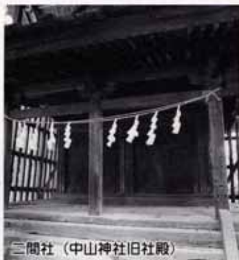
二間社（中山神社旧社殿）