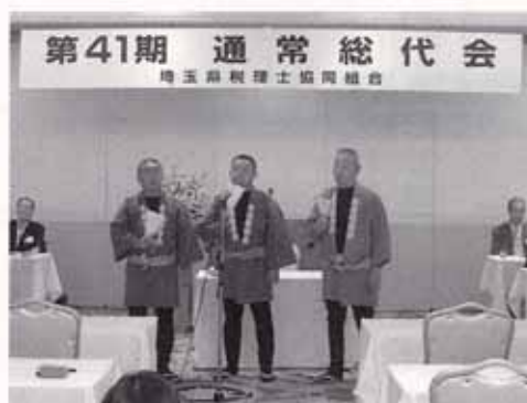
▲贈呈式で「木遣歌」を披露

この事業は「我が国において継承されてきたさまざまな伝統文化を子どもたちに体験・修得させ、次世代へ継承し発展させる」ことを目的としています。今年度は実施団体が増え、指定文化財の「木遣歌」「岩槻の古式土俵入り」（釣上地区・笹久保地区）「深作ささら獅子舞」「秋葉ささら獅子舞」「南部領辻の獅子舞」の保存会の皆さんが講師となって教室を開き、祭礼などでの公開にむけて、子どもたちが練習に励んでいます。