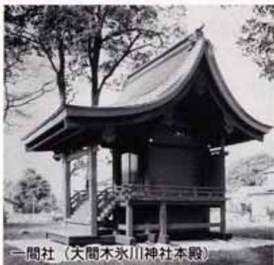
一間社（大間木永川神社本殿）

神社建築の規模を表す用語に「一間社」「二間社」という表現があります。普通、一間、二間というは尺貫法での長さ（一間（江戸間）＝6尺、約1.8m）を表しますが、神社建築の世界では正面の柱間を言います。つまり、柱と柱の間の空間が一間となり、これが二つあるのが二間です。ですから、一間社といっても柱間が長さ6尺というわけではありません。ちなみに神社ではありませんが「通し矢」で有名な京都の三十三間堂は、柱間が三十三で、柱が34本あります。市内では、一間社もしくは三間社が一般的ですが、他にはあまり例のない二間社も多いのがさいたま市の特徴です。