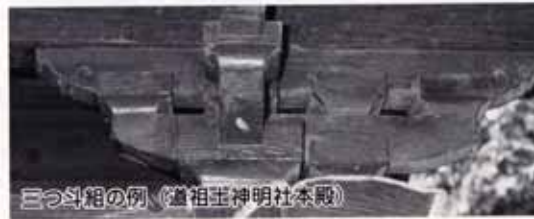
三つ斗組の例（道祖土神明社本殿）