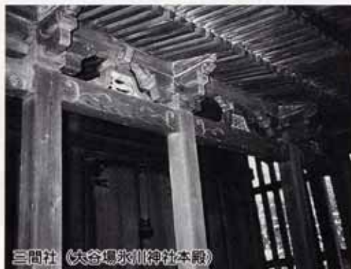
三間社（大谷塚永川神社本殿）