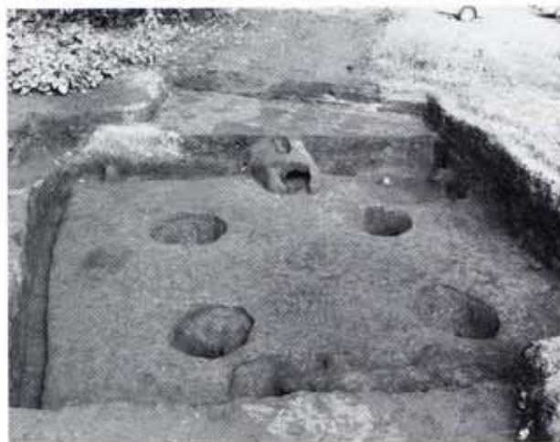
▲古墳時代後期の住居跡／札之辻3号遺跡