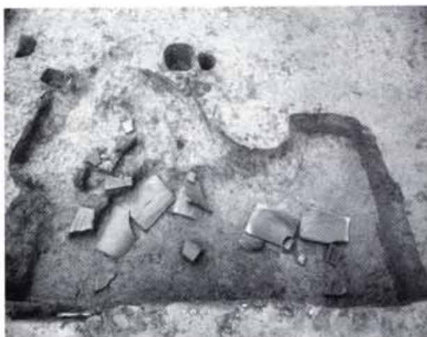
▲布目瓦の出土状況／道場寺院跡