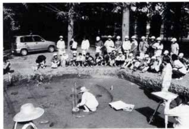
▲中尾小学校6年生の駒形南遺跡見学会 （縄文時代後期の住居跡）