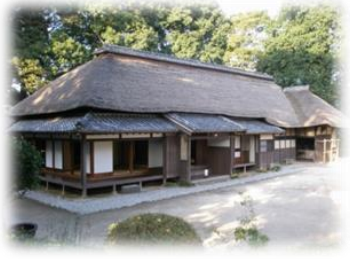
旧坂東家住宅主屋 ／自由に中を見学できます