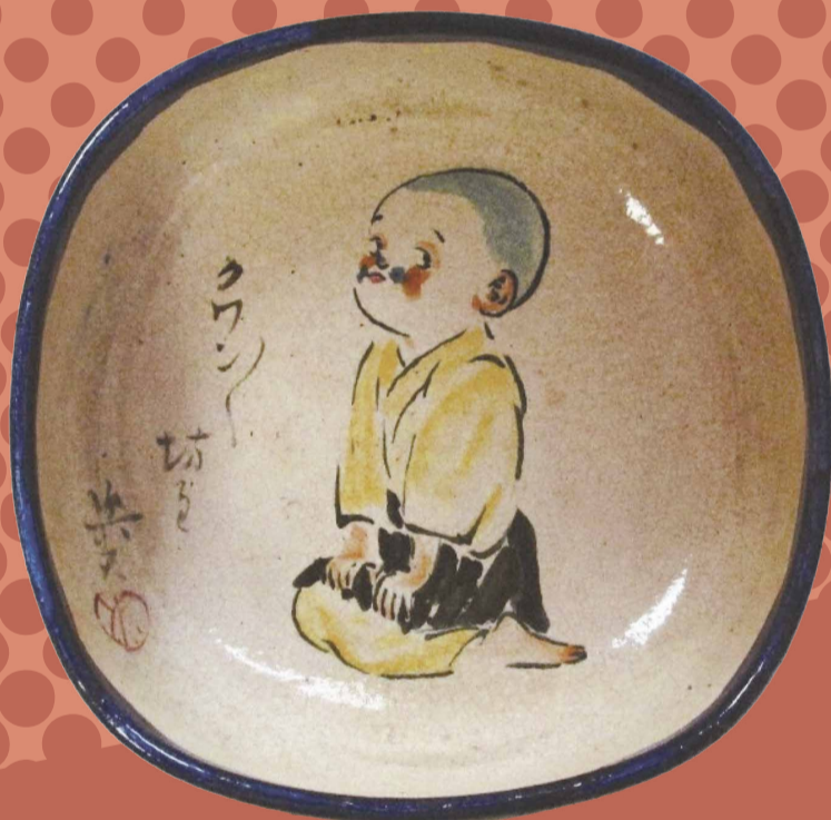
北沢楽天 楽焼鉢(くわんくわん坊主図) 1935年頃