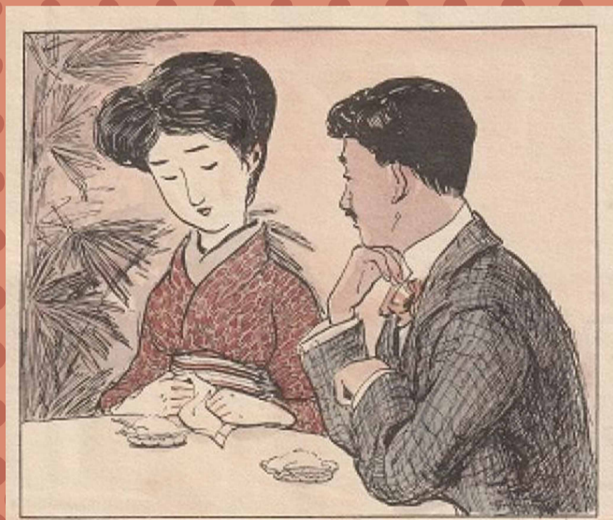
北沢楽天「愛即恋(アイスクリーム)」『楽天全集』9巻 1931年

【一般】大賞 賞金10万円ほか / 【ジュニア】大賞 賞金5万円(図書カード)ほか