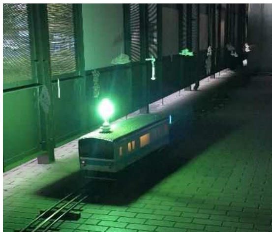
▲さいたま市文化施設味変企画「市内文化施設に現代アートのスパイスを」 連携先：鉄道博物館

国際芸術祭を市全体で盛り上げていくため、「盆栽」、「漫画」、「人形」、「鉄道」をはじめとする本市の魅力ある文化資源を活用したプロジェクトを展開するほか、既存の文化芸術団体等と連携したプロジェクトを展開します。