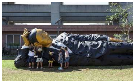
アイガルス・ピクシエ《さいたまサラリーマン》、2016年、さいたまトリエンナーレ2016