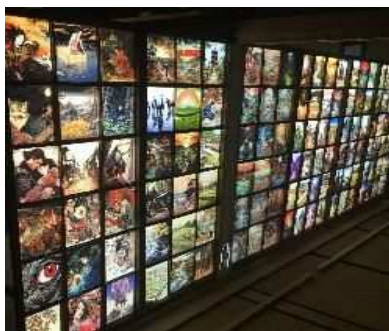
▲公募プログラム(和紙障子プロジェクションマッピング「大宮曼荼羅」、さいたま国際芸術祭2023