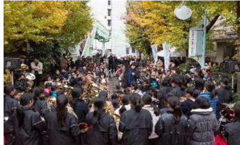
大友良英+Asian Music Network、《Ensembles Asia Special》、2016年、さいたまトリエンナーレ2016