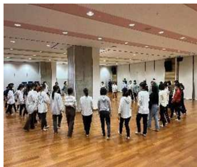
▲保護者資質向上研修会～振付が決まっていない踊りへ、さいたま国際芸術祭2023