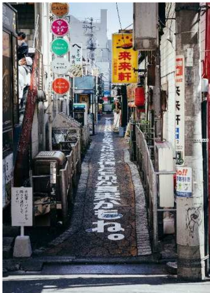
最果タヒ、《詩の加速》、2020年、さいたま国際芸術祭2020