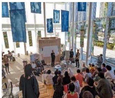
▲SAOP2023*オープニングセレモニー、さいたま国際芸術祭2023

展開にあたっては、アーティストと市民、地域との交流の場を創出することで、芸術祭全体での一体感の醸成を図り、市民の活動を市内外に発信します