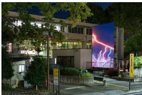
▲「Time Base Documents」(モニター内の画像は白鳥建二撮影) 2023年、さいたま国際芸術祭2023、Photo: 表恒匡、制作: 東日本電信電話株式会社 埼玉事業部、株式会社 NITT ArtTechnology、LED TOKYO 株式会社

国内外の一流・新進のアーティストによる、現代美術、音楽、ダンス、演劇などといった既存のジャンルに捉われない、領域横断的な作品やプログラムを展開します。