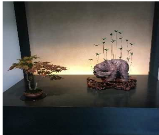
▲さいたま市文化施設味変企画「市内文化施設に現代アートのスパイスを」 連携先：大宮盆栽美術館