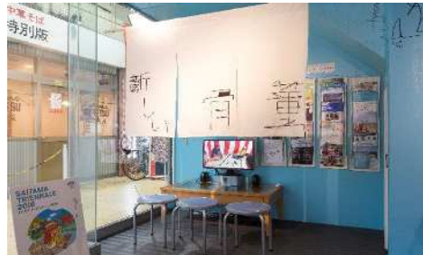
新しい骨董、《新しい骨董市/記録映像》、2016年、さいたまトリエンナーレ2016/撮影: Arecibo 忽那光一郎