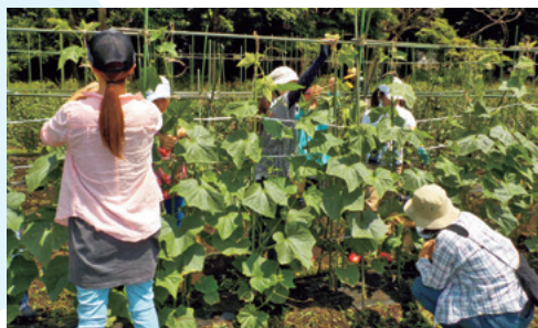
親子農業体験教室