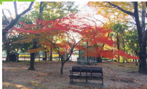
市民の森のもみじ