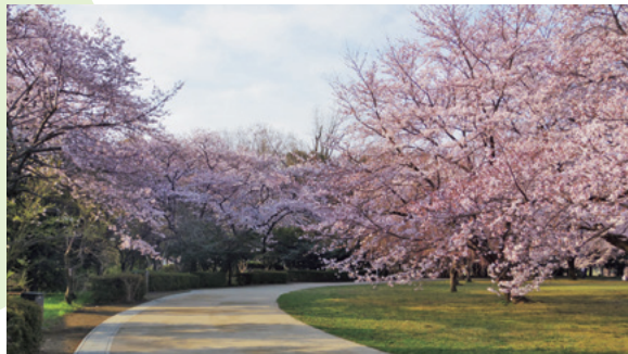
市民の森の さくら