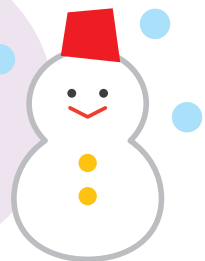
市民の森の冬景色