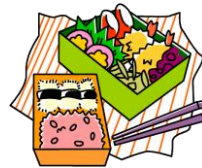
box lunch ボックス ランチ