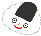
rice ball ライスボール