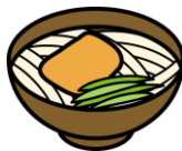
udon (japanese noodles) うどん または ジャパニーズ ヌードー