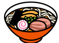
ramen (chinese noodles) ラーメン または チャイニーズ ヌードー

シーン2 あなたの すきな どうぶつは ななに？ ワット エニマル ドウ ユー ライク What animal do you like?