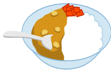
curry and rice カレー エン ライス