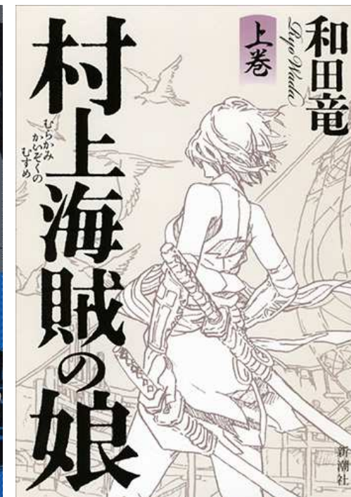
和田竜著『村上海賊の娘（上）』（新潮社刊）

和田竜（わだりょう） ： 映画脚本『忍ぶの城』で城戸賞を受賞。2007年、同作を小説化した『のぼうの城』でデビュー。同作は映画化され、2012年に公開。2014年『村上海賊の娘』で吉川英治文学新人賞、本屋大賞および親鸞賞を受賞。他の著作に『忍びの国』などがある。