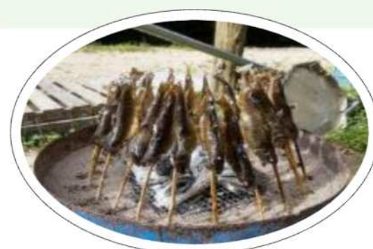
イワナさばき & 炭焼き体験