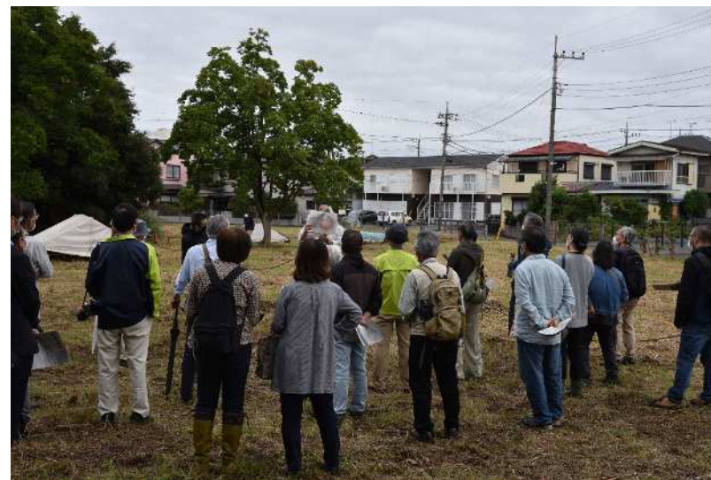
昨年度の見学会の様子