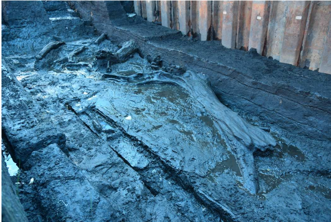
縄文時代晩期（約3,000年前）の泥炭層から出土した木材