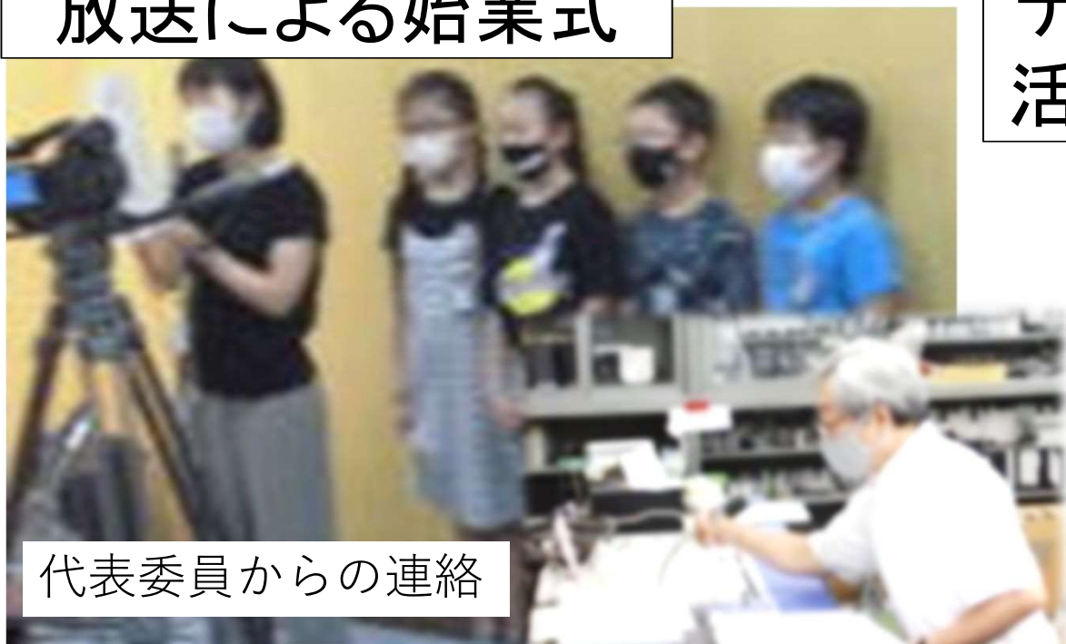
代表委員からの連絡