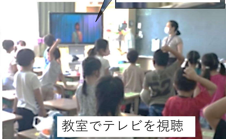
教室でテレビを視聴