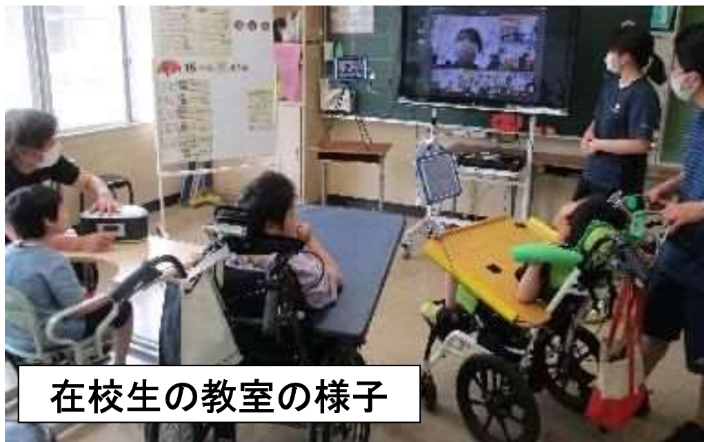
在校生の教室の様子