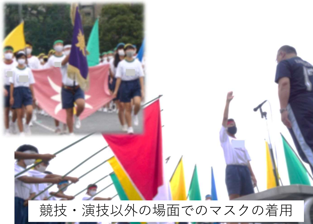
競技・演技以外の場面でのマスクの着用