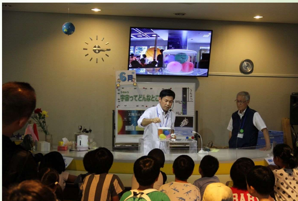
過去に行われたサイエンスショーの様子

10月6日（土）～10月28日（日）の土・日・祝 期間中 15:10～15:30 2階サイエンスショーコーナー