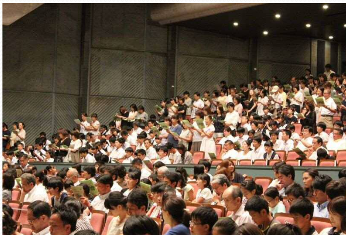
写真：平成28年度いじめ防止シンポジウム

大宮北高校の生徒たちが、総合司会を務め、いじめ防止シンポジウムの意義や歴史について説明を行います。