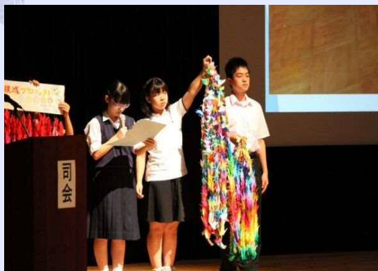
平成28年度 取組発表の様子

いじめの4層構造のビデオや小中連携して行った取組について発表します。また、昨年度参加した「全国いじめ問題子どもサミット」の様子を伝えます。