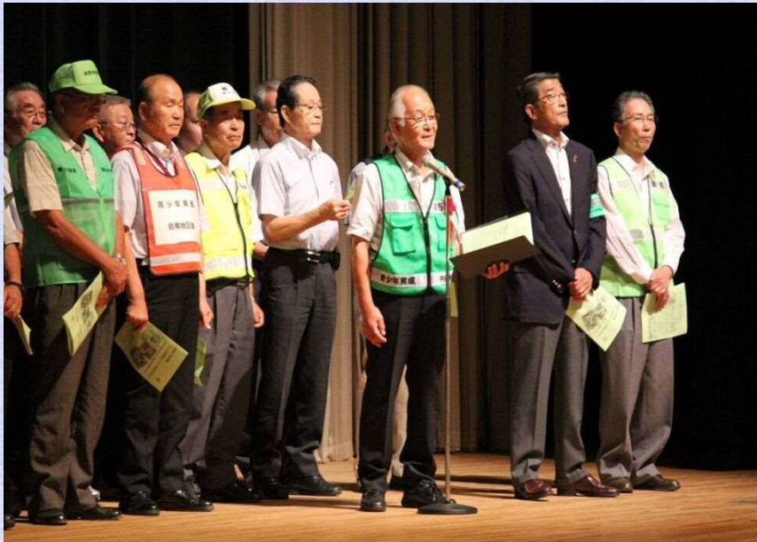
平成28年度の青少年育成さいたま市民会議による 「いじめ防止のための5ヶ条」發表の様子

青少年育成さいたま市民会議、さいたま市PTA協議会の方々がいじめ防止に向けてメッセージを發表します。