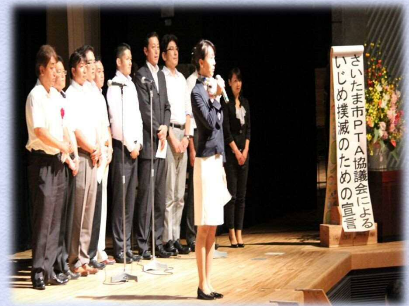
平成27年度のさいたま市PTA協議会による 「いじめ撲滅スローガン」發表の様子