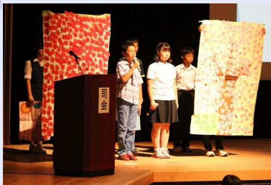
平成28年度 取組発表の様子