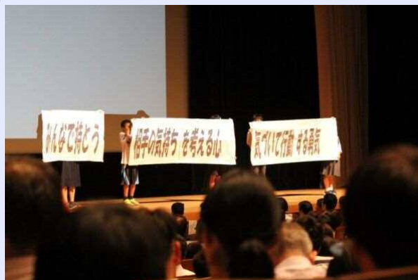
平成28年度 取組発表の様子