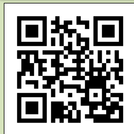
動画用二次元コード (YouTubeへ飛びます)