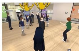
【3Dメタバースでの交流の様子】