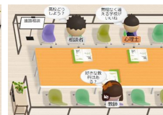
【メタバースを活用して専門職に悩みを相談したり、進路について相談したりする様子】