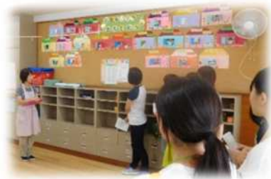
体感ツアー（施設見学）の様子