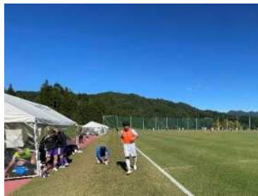
サッカー交流大会