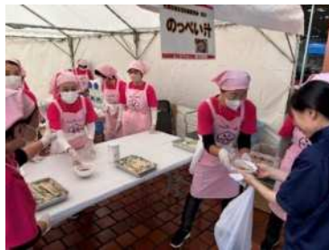
ふるまいコーナー