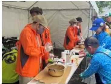
ふるまいコーナー