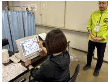
健康づくりコーナー