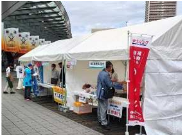
駅前交流イベント