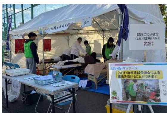
(埼玉県鍼灸師会ブース)