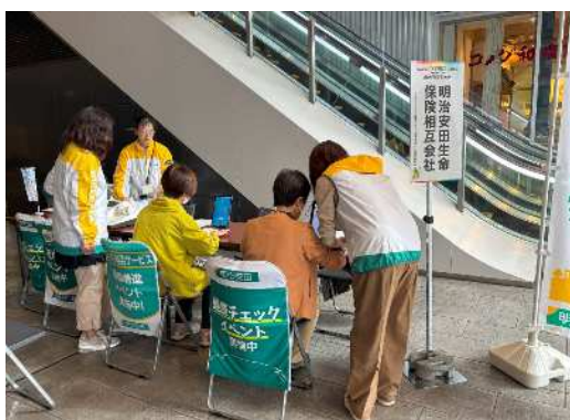
(明治安田生命保険相互会社ブース)