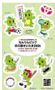
(ノベルティシール)