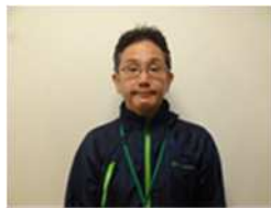
サービス管理責任者

槻の木は、利用者が自立した日常生活又は社会生活を営むことができるよう、利用者の心身の状況、能力、希望や生活環境等を踏まえて、それぞれの方に合わせた支援計画の作成をします。