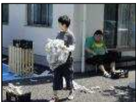
アルミ缶リサイクル