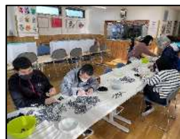
内職（機械部品組み立

現在の作業は、さをり織り、アルミ銅線はがし、農作業、藍染など。利合わせ、様々なことに取り組んでいる作品や育てた野菜の販売も行って個性に合わせた作業を通して、社会標として、毎日取り組んでいます。