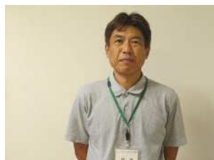
槻の木第2やまぶき所長

さいたま市槻の木第2やまぶきは、障害のある方に就労の機会を提供するとともに、生産活動その他の活動の機会を提供し、その知識及び能力の向上のために必要な訓練を行う施設です。周辺は豊かな自然と住宅街で、静かで落ち着いた環境となっています。