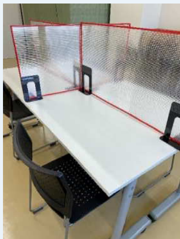
感染症対策の為、仕切りを使用