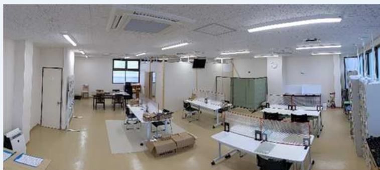
玄関から事業所内を見渡した様子