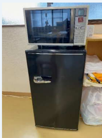
冷蔵庫、電子レンジ完備