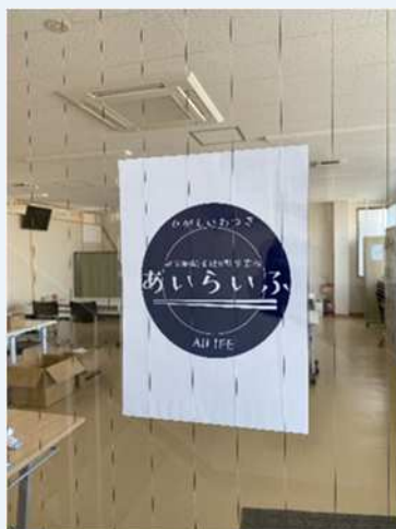
あいらいふのロゴ (入口玄関)