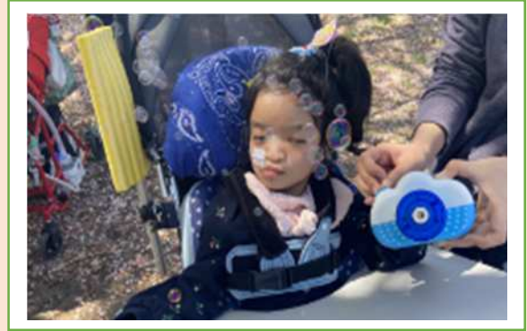
☺ 近隣の公園を散策 ☺