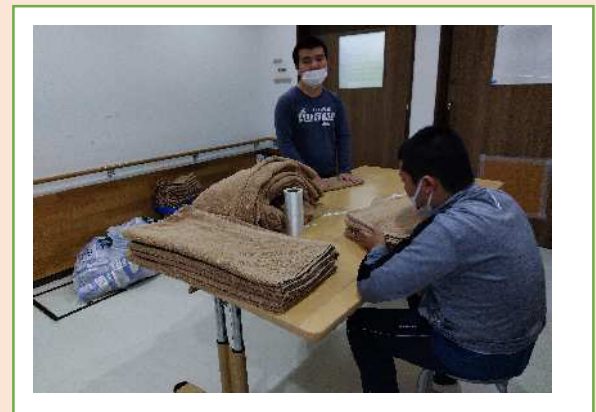
☺ スポーツジムのタオルたたみ作業 ☺