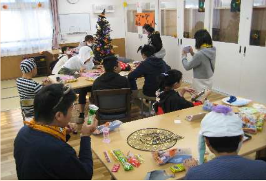
☺ 創作活動 ☺