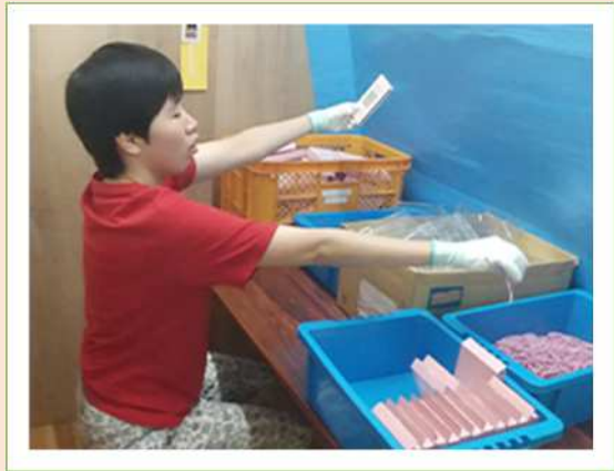
☺ 付録つき雑誌のリサイクル仕分け ☺