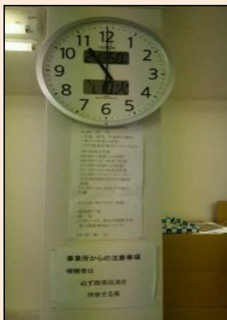
毎日のスケジュール表