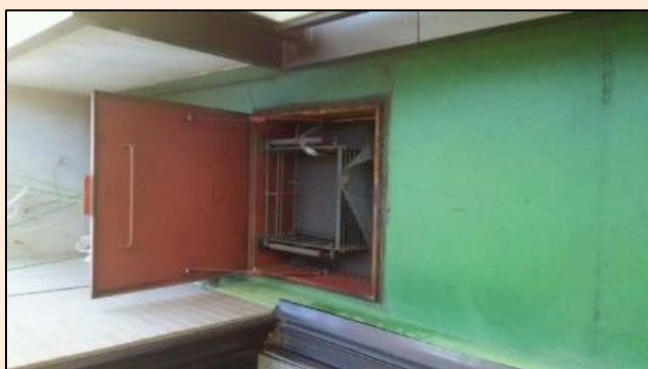
避難訓練 施設にて。9月の防災月間に行いま した。この施設には通常出口のほかには非常はし ごがあります。