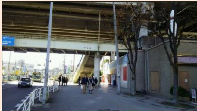
別所沼公園近くのバス停 別所沼公園でお花見をしたことがありました。