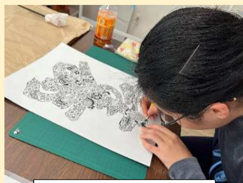
個別訓練の切り絵の様子

利用者の中には、これまでの生活でなんとなく自分はいまうまくいかないと感じている方が少なくありません。 自立訓練では、自分の得意分野なことや潜在的な能力を見つけ自覚し、それを活かして社会に参加し充実した生活を送ることを目標としています。