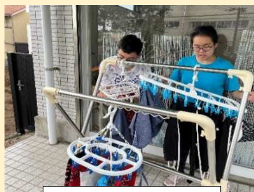
洗濯干し練習の様子

体力を向上させ、生活リズムを整え、お一人お一人の課題に応じて活動に取り組みます。また、洗濯や清掃、お金の管理など実生活に必要な知識やスキルを高めることなどにも取り組み、自立した生活を目標としています。