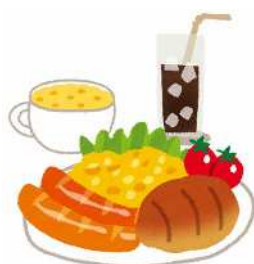
余暇支援では朝食作り♪