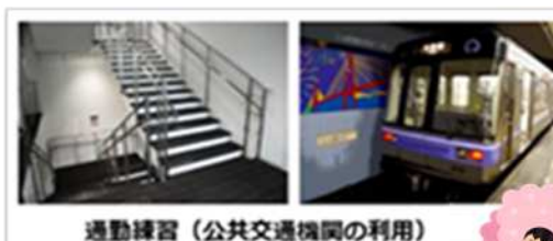
通勤練習（公共交通機関の利用）

理学療法士、作業療法士が同行し、自宅から事業所または職場までの歩行、電車やバスに乗る練習、エスカレーター、人混みの中を歩く練習などを行います。