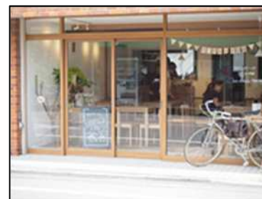
従たる事業所 ひとつながるカフェ