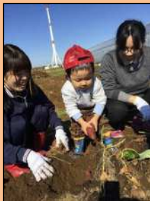
地域の子供と芋掘りの様子。