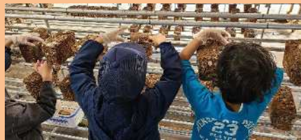
地域の子供たちがしいたけ狩りを体験。