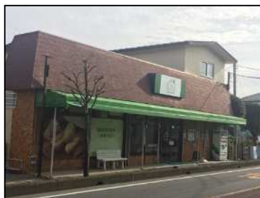
主たる事業所 しびらきベーカリー