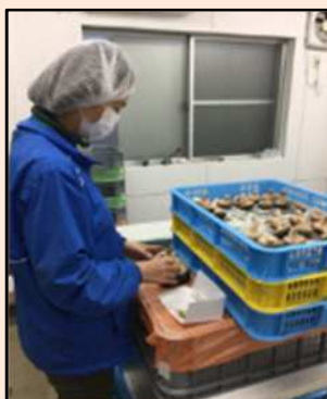
パックの仕分け作業。 常時、3 種類のパックを作成し てパック器に流しています。