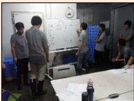
栽培棟の収穫方法、チームミーティング。 収穫量を増やす、安定させるために話し 合いを行っています。