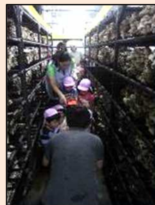
近隣保育園の 収穫体験。