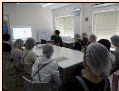
地元スーパーマーケットのお取引先様の 見学受け入れ。 事業説明をさせて頂き、その後は実際に働 いて頂きました。