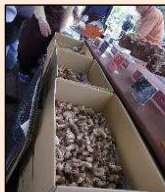
代官山ヒルサイドテラスのイベント出店。 椎茸の新しい価値の提案と、精神障がい の方が働いている姿を社会に発信してい ます。