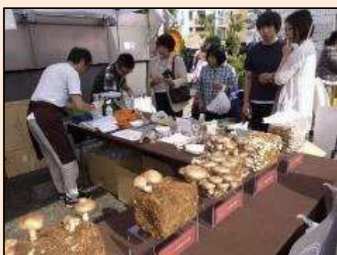
代官山の猿楽祭に参加しました。 企画、運営をスタッフで行って もらい、椎茸の新しい質や価値を 提案しました。