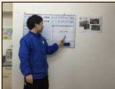
朝 10 時から朝礼。 作業分担の発表