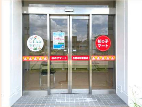
杉の子マート「与野本町駅前店」

「いらっしゃいませ」が云えなくても中々笑顔になれなくても店員さんには成れます。杉の子マート「与野本町駅前店」は、与野本町駅から歩いて2分程度の新幹線のガード下ではありますが在来線のような通過音は感じられない快適な環境です。