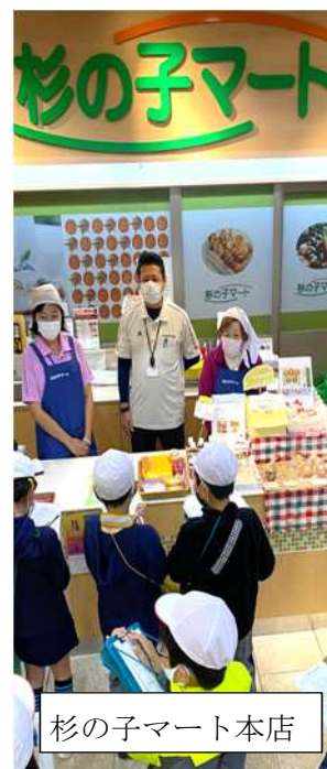
杉の子マート本店

生活介護事業所杉の子マート与野本町駅前店は、JR与野本町駅から徒歩2分の好立地、杉の子マート指扇店は指扇駅近くと言う立地で、コンビニの店員さんとして働いてみたいと言う障害者の方たちの働く場として開設しました。