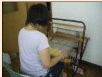
【軽作業】さをり織り（織物）を行っています。織った布は、雑貨やバッグに加工します。