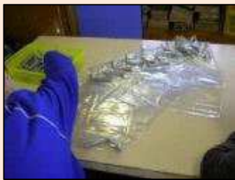
【軽作業】機械付属品のセット作業です。