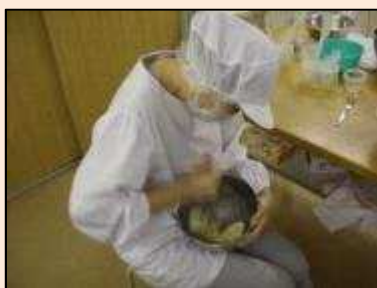
【製菓作業】バターをハンドミキサーで混ぜるのが基本作業です。