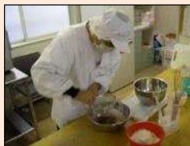
【製菓作業】製菓に関する工程はとても多いですが、できる工程を少しずつ増やせるよう支援しています。