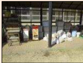
【軽作業】近隣にお住まいの方々のご協力を得て、アルミ缶のリサイクル作業を行います。