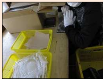
【軽作業】プラスチック製品の分別作業です。