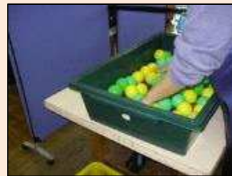
【軽作業】社会福祉施設にあるボールプールのボール洗浄作業です。洗剤で洗い、すすぎ終わったら一つずつタオルで拭きます。