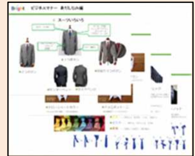
ビジネスマナー講座 挨拶・身だしなみ・電話応対まで基本のスキルが身につきます。