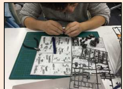
ものづくり講座 (プラモデル)の様子