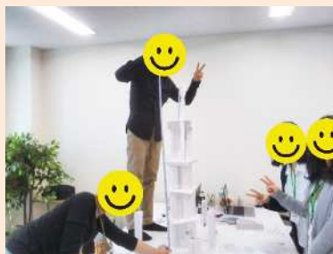
グループワーク講座 テーマにあわせてチームで取り組むことにより、集団内でのやり取りを学んでいきます。