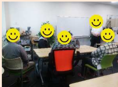
SST 講座 上手に周囲の方と仕事ができるスキルを安心して学べる機会となるように取り組んで行きます。