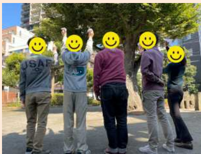
コミュニケーション講座 楽しみながら周囲の方とのコミュニケーションの取り方を学んでいきます。