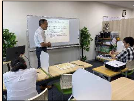
就職対策講座 一般企業に勤務経験のある外部講師から就労活動のノウハウを学ぶことができます。