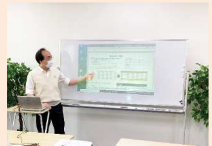
PC 基礎講座 (エクセル・ワード) 講座に加え、自宅でも取り組めるオンライン学習プログラムも導入しております。