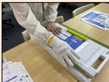
作業訓練 (パンフレット断裁)の様子