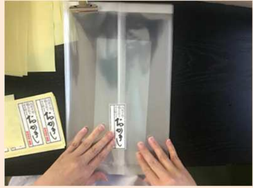
シール貼りは、曲がない様に丁寧に。