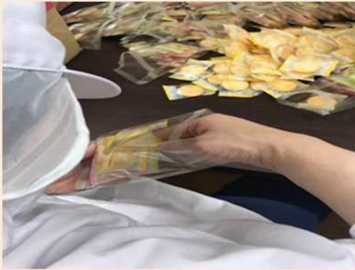
個包装のおせんべいをキレイに並べたり。