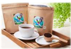
○コスタリカコーヒー