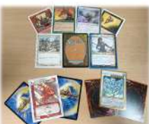
○トレーディングカード