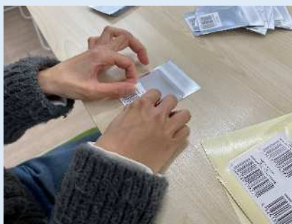
★袋にバーコードを貼っていきます。