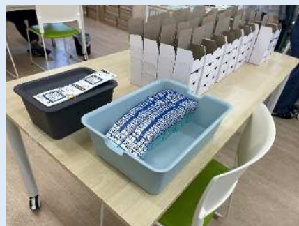
★箱詰め作業をしていきます。