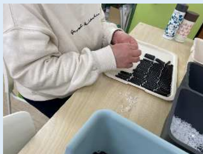
★部品と部品を組み合わせます。