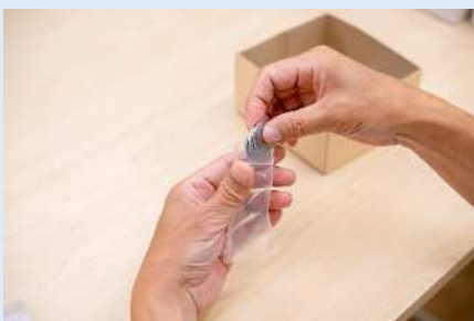
★封入作業をしています。