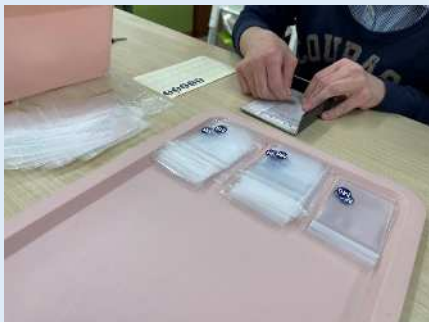
★袋にシールを貼ります。