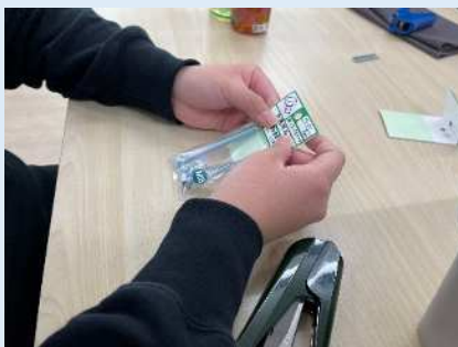
★封入後にヘッダーを取り付けます。