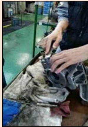
〈部品の洗浄・解体作業〉

製品を入れる箱の組み立てを行います。中に商品を入れたときに、抜けないように確認を行なっていきます。