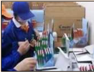
シャープペンのディスプレイを挿しています。