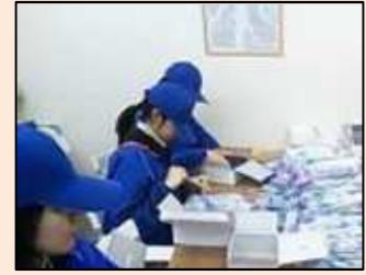
シャープペンの袋詰めを行っています。