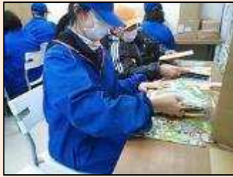
封入作業を行っています。 一人一人出来る事をやっています。