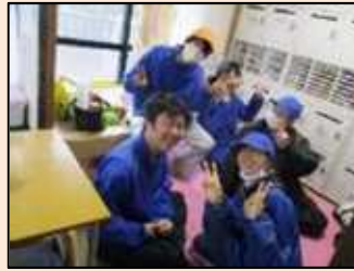
休憩中はみんなでおしゃべりしたりしています。