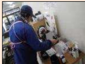
商品の在庫チェック。 何の商品がいくつあるかの確認も職員任せではなく自分たちで行います。