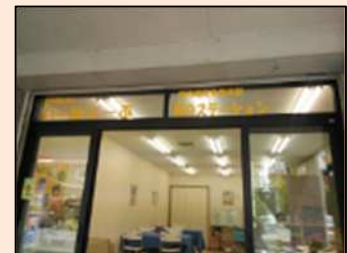
準備完了。いよいよお客様をお迎えます。皆、笑顔と挨拶を忘れずに！