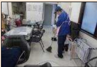
サロンに着いたら、すぐに掃除です。お客様に快適に過ごしてもらう為に皆一生懸命です。