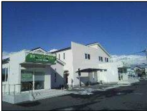
湯澤トレーニングセンターと併設されている湯澤整形外科リハビリクリニック