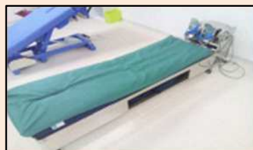
ミルキングアクション

機械で足首を動かし、「第二の心臓」と言われるふくらはぎの筋肉を動かすことで血液の循環を促します。