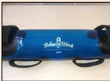
ウォーターバッグ

水の入ったバッグを持ちトレーニングを行うことで、下肢・体幹筋力の強化が行えます。バッグの中の水が動くため、体幹の強化に適しています。