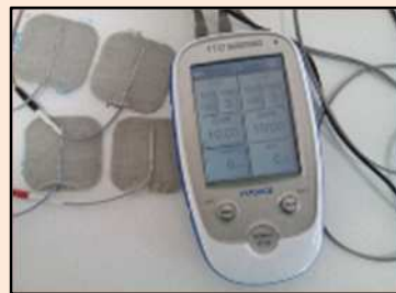
EMS（電氣的筋肉刺激装置）

小豆とビー玉の入った箱の中からお椀で小豆とビー玉をすくい上げたり、手を入れてかき混ぜたりすることで、手指や手首を鍛えます。