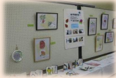
行事名：みのり園作品展 時期：例年2月 場所：みのり園 内容：各教室参加者の作品展示、施設紹介、授産製品の販売等 ※感染症状況を鑑みて実施