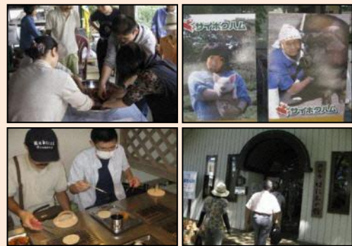
行事名：散策 時期：不定期（年5回程度） 場所：主に市内、近隣市町の史跡等 内容：紅花染め、川越散策、鉄道博物館や人形博物館の施設見学等