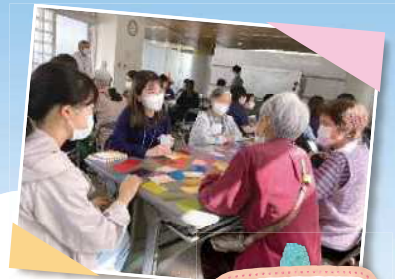
学生と一緒に色かいた