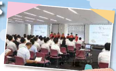
従業員が受講 認知症サポーター 養成講座