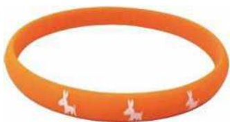
認知症サポーターの証 「オレンジリング」