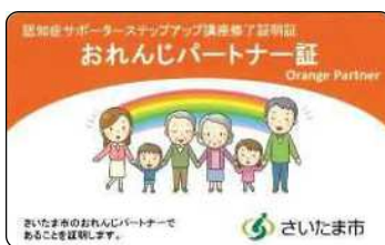
修了の証 「おれんじパートナー証」