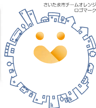
さいたま市チームオレンジ ロゴマーク