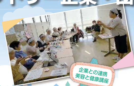
企業との連携 美容と健康講座