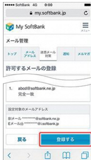
(6) 「登録する」を押します。