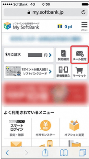
(1) My SoftBankへアクセスし、「メール設定」を押します。

※S!メール (MMS) と Eメール (i) での受信許可リスト設定が可能です