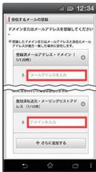
(5) 表示した入力欄(登録済メールアドレス・ドメイン)に info@qr-d.jp を入力