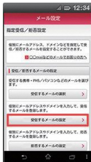
(3) 【受信するメールの設定】を押下