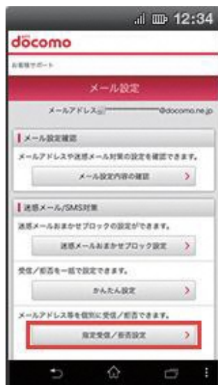
(1) 【指定受信/拒否設定】を押下