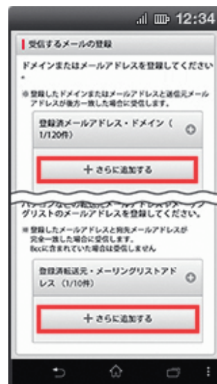
(4) 【登録済メールアドレス・ドメイン】の【さらに追加する】を押下