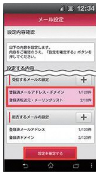
(7) 設定内容をご確認のうえ、【設定を確定する】を押下