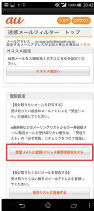
(1) [受信リストに登録／アドレス帳受信設定をする]を選択