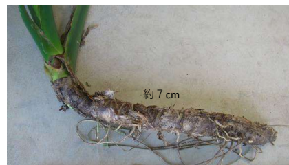
クワズイモの根茎