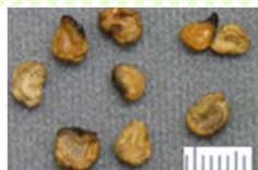
チョウセンアサガオの種子