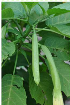
キダチチョウセンアサガオの蕾