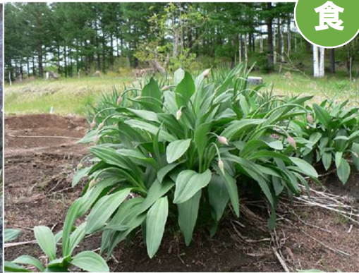
ギョウジャニンニク