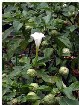
チョウセンアサガオ