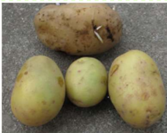
皮が緑色になったジャガイモ