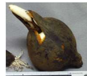
イヌサフランの球根