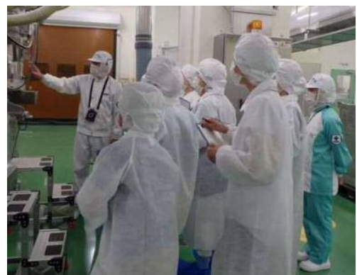
平成29年度一日食品衛生監視員 工場内監視の様子