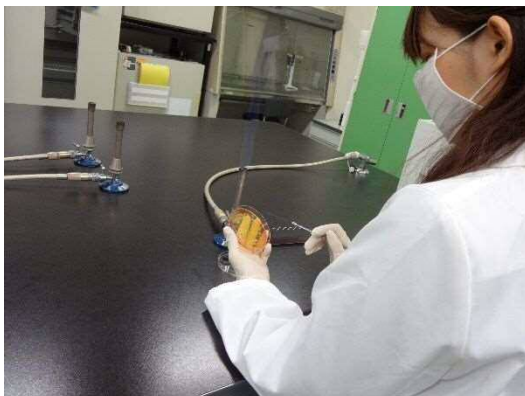
微生物検査の様子

食品に含まれる放射性物質に対する安全性の確保及び消費者の不安を払拭するため、市内を流通する食品の放射性物質の検査を実施します。