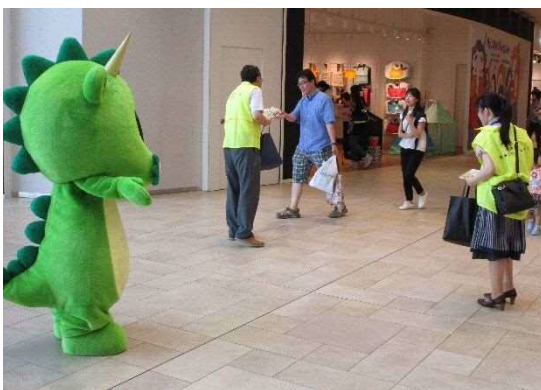
街頭キャンペーンの様子

ノロウイルスによる食中毒や感染症に対する正しい知識の習得と調理従事者による二次感染を未然に防止することを目的に、市内の福祉施設や学校等にノロウイルスに関するリーフレットの配布や研修会を開催するとともに、消費者への街頭キャンペーンを実施し、知識の普及啓発を図ります。