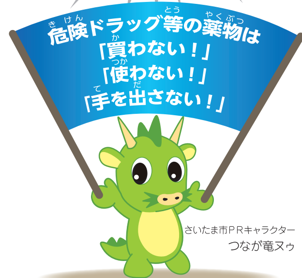
さいたま市PRキャラクター つなが竜又ウ